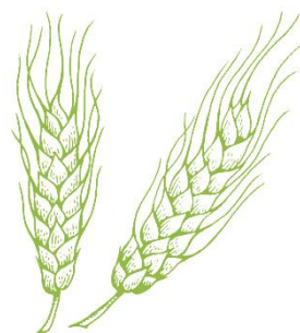
Масло зародышей пшеницы (Протеины пшеницы)